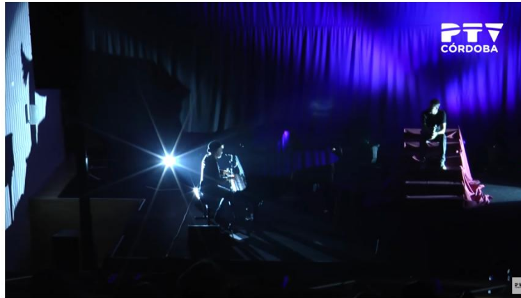
Jarabe de Palo en el Palacio de Congresos 157 visualizaciones

Link: https://www.youtube.com/watch?v=PiHRL71zAo0